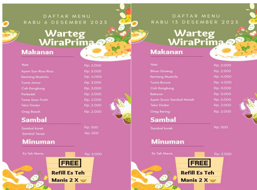
Gambar 2. Menu Wira Prima

Tabel diatas merupakan paparan terkait waktu operasional dari program Wira Prima. Pada tabel tersebut, Penulis memaparkan waktu operasional, diluar persiapan sebelum operasional. Waktu operasional program ini umumnya mencakup Hari Pelaksanaan yaitu Program Wira Prima dijalankan pada hari rabu untuk kegiatan tertentu. Jam Operasional dilaksanakan dimulai dari pukul 10.00 hingga 13.15.00 WIB, pada saat makan siang baik mahasiswa, dosen maupun karyawan Politeknik Pariwisata Prima Internasional. Berikut adalah daftar menu dari Program Wira Prima dapat dilihat pada Gambar 2, dibawah ini: