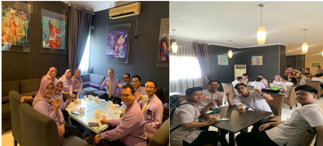
Gambar 3. Kegiatan Konsumen Wira Prima

Gambar 2 adalah contoh menu yang disediakan. Wira Prima memiliki slogan “ Different week, Different taste ”, yang memiliki konsep beragam menu setiap minggunya, dengan menyeimbangkan cita rasa yang konsisten serta harga yang terjangkau bagi warga Politeknik Pariwisata Prima Internasional. Selanjutnya pada halaman berikutnya terdapat gambar 3 dimana kegiatan konsumen Wira Prima sedang menikmati menu yang disediakan. Berikut adalah gambar konsumen Wira Prima.