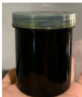
Gambar 1. Ekstrak Daun Belimbing Wuluh