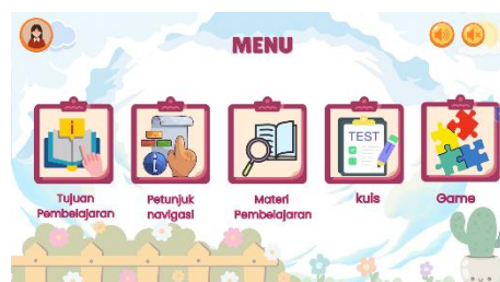
Gambar 2. Tampilan Menu Materi Perubahan Wujud Benda