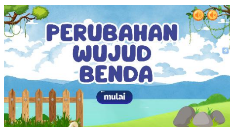
Gambar 1. Tampilan Halaman Utama Multimedia