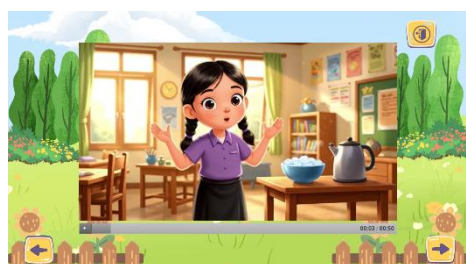
Gambar 3. Tampilan Video Pembelajaran